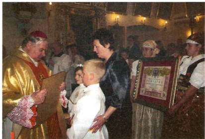
Wśród darów pamiątka nawiedzenia kościoła jubileuszowego w Simoradzu

Kościół św. Jakuba w Simoradzu jest jednym z najstarszych na Śląsku Cieszyńskim. Jego część pochodzi prawdopodobnie jeszcze z XV wieku. Odwiedzających go turystów zainteresuje z pewnością cenny i piękny wystrój świątyni: gotyckie i renesansowe freski, XVII-wieczne płyty nagrobne Skoczowskich z Kojkowic, gotyckie sakramentarium oraz zabytkowe obrazy, z tym głównym, przedstawiającym św. Jakuba – patrona parafii i świątyni.