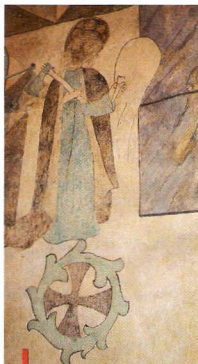
Zabytkowe malowidła zdobią ściany i sklepienie prezbiterium

– Ten ołtarz jest z kamienia, podobnie jak cały nasz kościół. Kamień to mocny fundament. Tak mocne są wartości, którymi chcemy żyć i dzie-